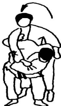
ERI SEOI NAGE