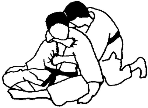
OKURI ERI JIME